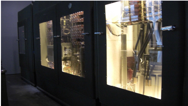
Abbildung 1 Müzedeki dünyanın en eski bilgisayarı

20 Haziran 2010 tarihinde 'Zentrum für Kunst und Medientechnologie' e gezi düzenlenmiştir. 25 kişi etkinliğe katılmıştır. Sonrasında bir lokantada birlikte oturup, yemek yenip güzel bir gün geçirilmiştir.